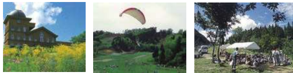
自然特性を活かした高原やスキー場