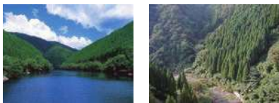
中国山地の威厳ある連峰、母なる清流の源