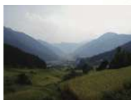
母なる川、千種川・揖保川と 暮らしが密接に結びついた風景