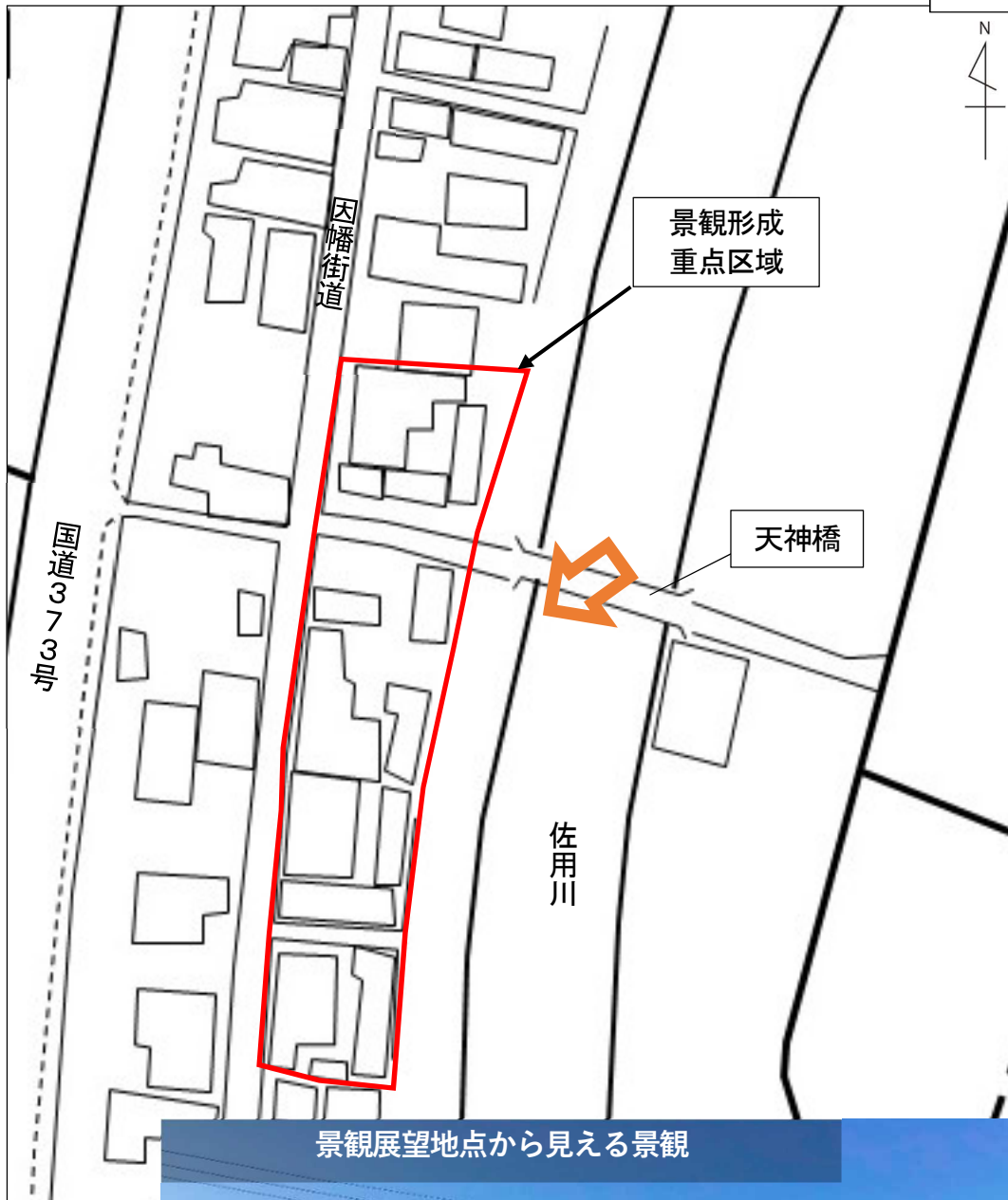
景観展望地点から見える景観