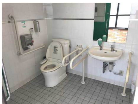
広くて使いやすい多目的便所