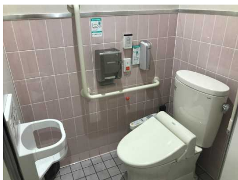
一般便所にも両側手すりを設置 (片側跳ね上げ式)