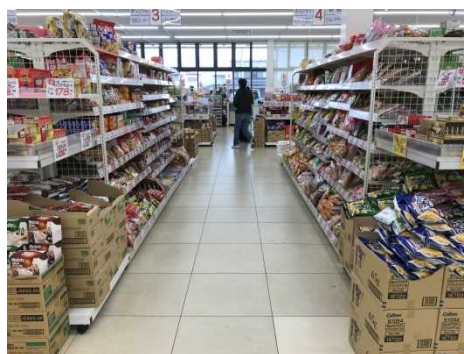
すれ違いに配慮した通路幅が広い売場