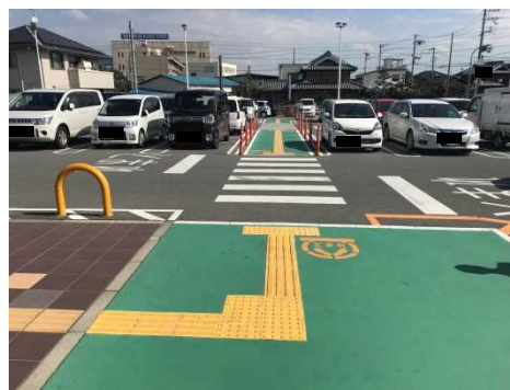
歩行者用通路をカラー塗装し安全面に配慮