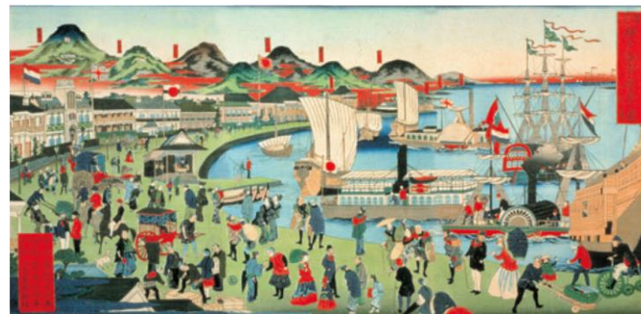
摂州神戸 海岸繁栄之図