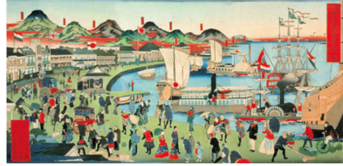
摂州神戸海岸繁栄之図