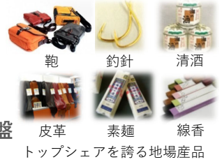
皮革 素麺 線香 トップシェアを誇る地場産品