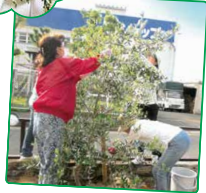
みんなで楽しく オリーブの実を収穫