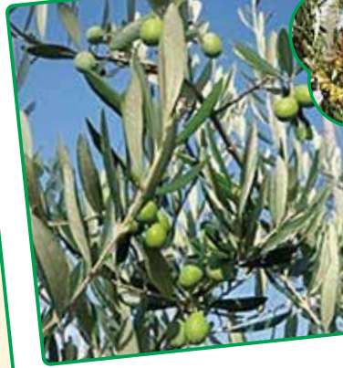
オリーブが立派に 実りました！

都賀川沿いの公園にオリーブの木をたくさん植えました。公園のお掃除にも力が入ります。朝日の中でオリーブの銀葉が道行く人たちに「おはようさん」。繁った葉は捨てないで、ちよっぴり辛い健康茶に。実を集めて塩漬けにもトライ。冬はリースを編んで地域の施設に飾っています。