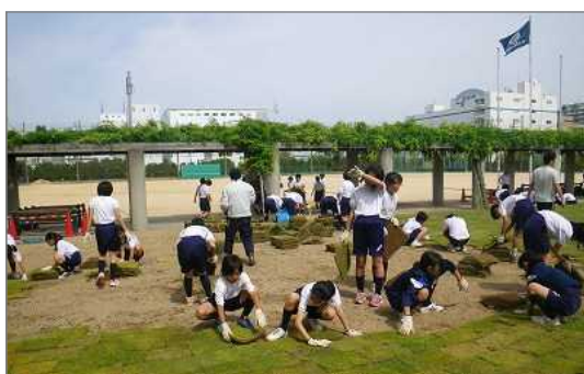
<整備中>生徒たちによる芝張り