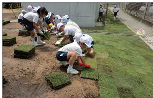
小学校の生徒たちによる芝張り（太子町）