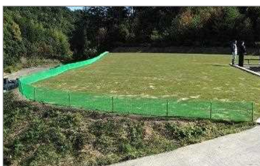
地域の公園とその法面を芝生化（福崎町）