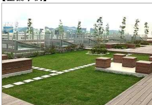
樹木と芝生による屋上緑化（姫路市）