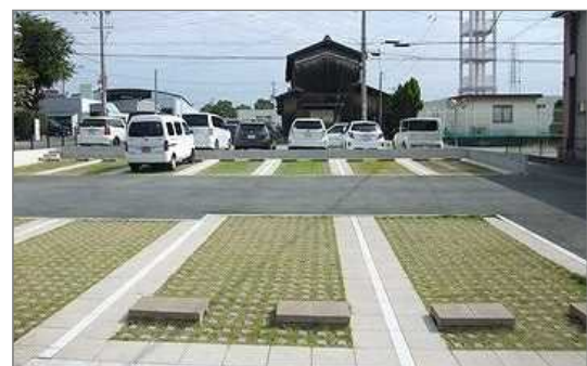
歩行性に配慮した芝生化駐車場（高砂市）