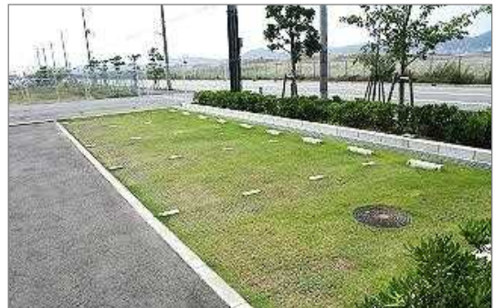
プラスチックマット型の芝生化駐車場（神戸市）