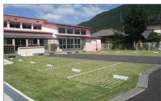
＜整備後＞コンクリートブロックで補強の芝生化駐車場（養父市）