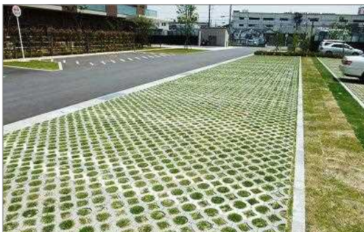
老人福祉施設の芝生化駐車場（宝塚市）