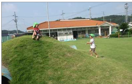
芝生化された幼稚園の園庭（神戸市）