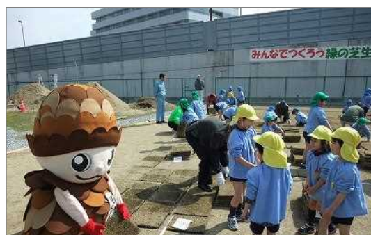
＜整備中＞地域の子もたちによる芝張り