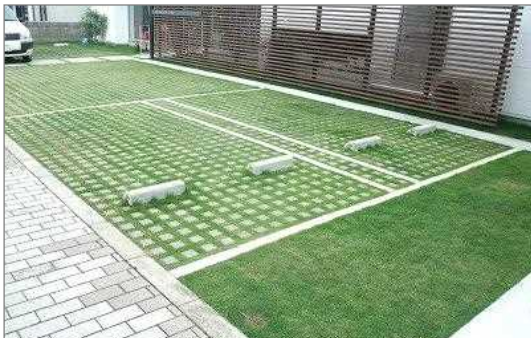
コンクリートブロック型の芝生化駐車場（尼崎市）