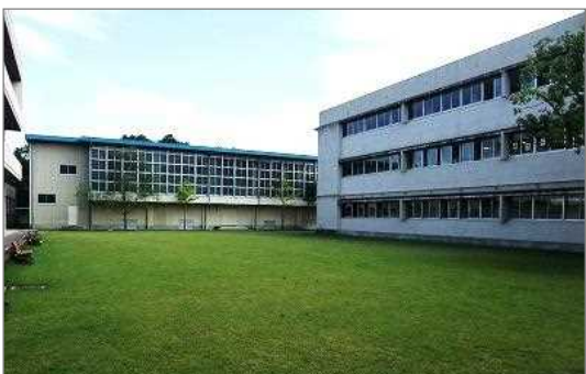
芝生化された中学校の校庭（猪名川町）