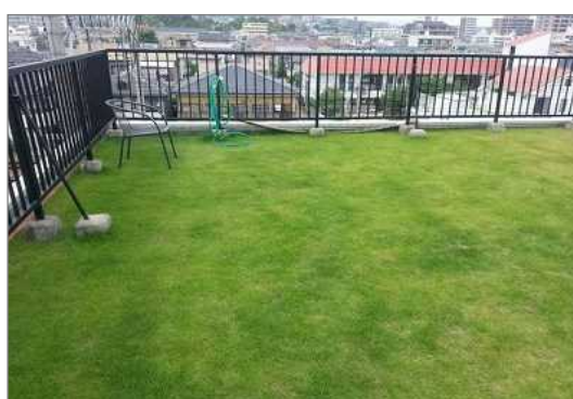
芝生による屋上緑化（西宮市）