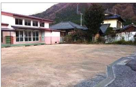
＜整備前＞未舗装の駐車場