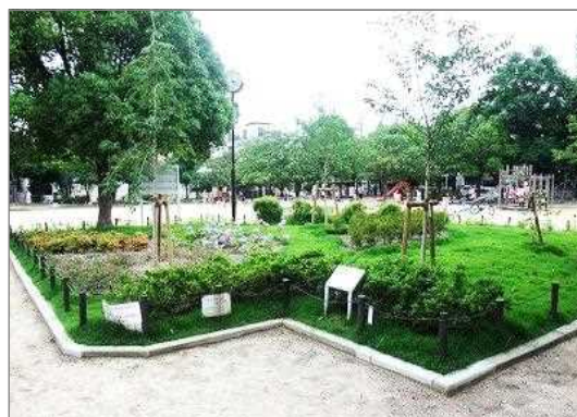
<整備後>公園花壇を再整備（西宮市）