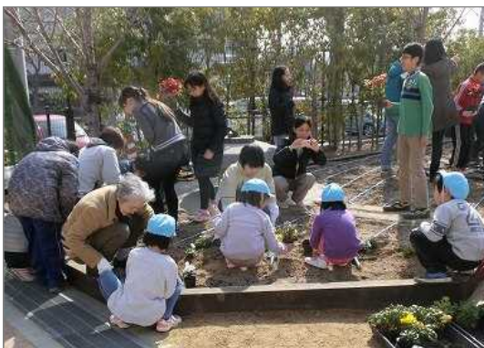
小学校内で地域住民と生徒たちが植栽（芦屋市）