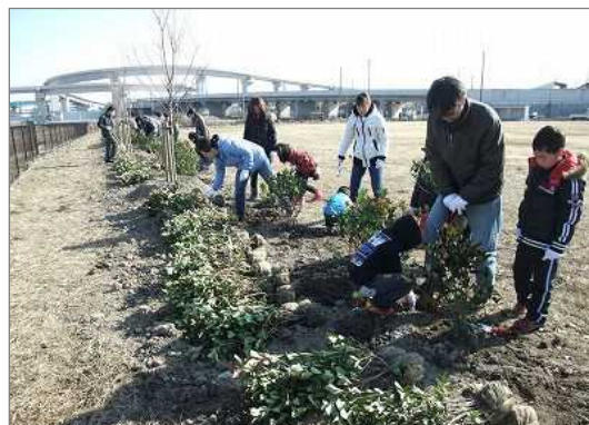
地域の公園を町内会で植栽（加古川市）