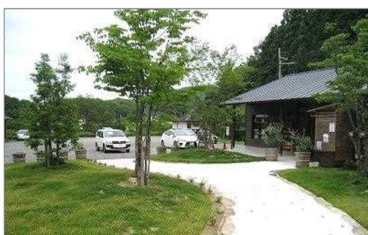
施設内の敷地を芝生化（篠山市）