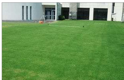
<整備後>芝生化された中学校の校庭（西宮市）