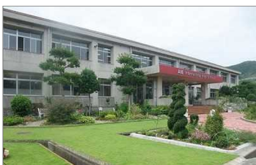
芝生化された高等学校の中庭（淡路市）