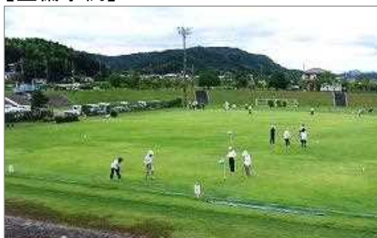
地域住民の交流広場を芝生化（加西市）