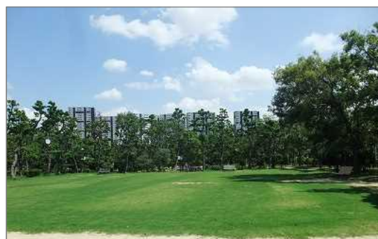
芝生化された公園（芦屋市）