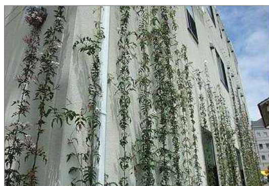
登はん型による壁面緑化（播磨町）