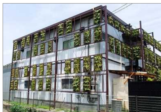
基盤造型による壁面緑化（伊丹市）