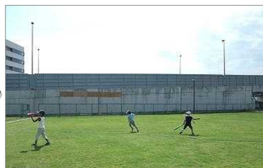
＜整備後＞芝生化された地域の広場（高砂市）