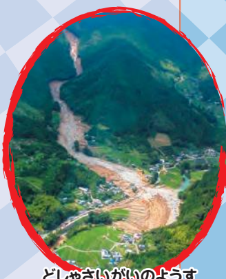
どしゃさいがいのようす

これまでの入賞作品は国土交通省砂防部Webサイトで見るができます。 https://www.mlit.go.jp/mizukokudo/sabo/kaiga_sakubun.html