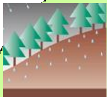
森林の整備・保全