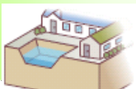
調整池の設置・保全 (宅地開発をするとき等)