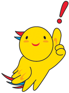
兵庫県マスコット「はばタン」