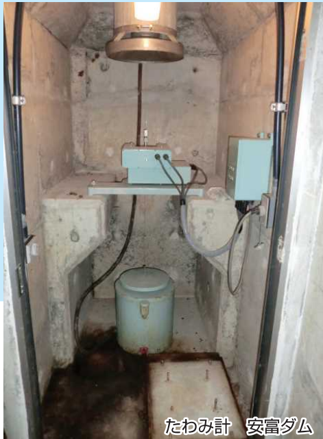
たわみ計 安富ダム