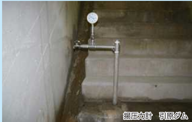
揚圧力計 引原ダム