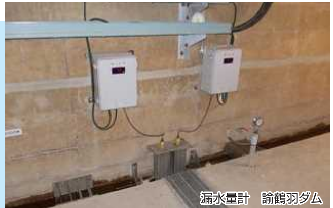
漏水量計 諭鶴羽ダム