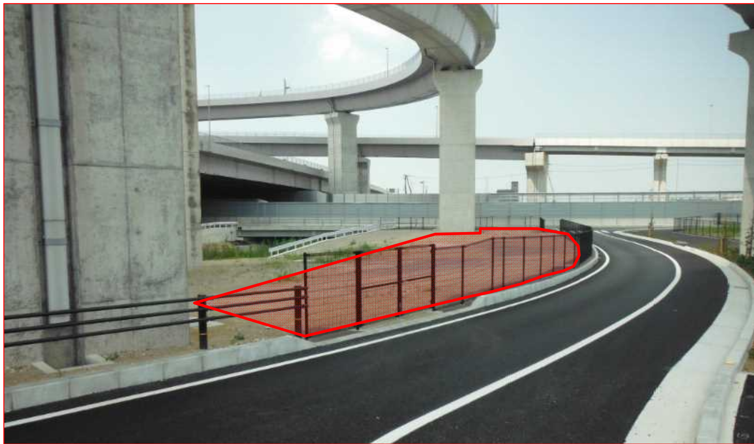
(3) 現地写真(物件番号:②)