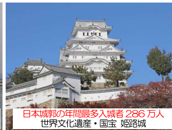
日本城郭の年間最多入城者 286万人 世界文化遺産・国宝 姫路城