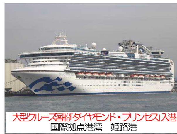
大型クルーズ客船ダイヤモンド・プリンセス入港 国際拠点港湾 姫路港