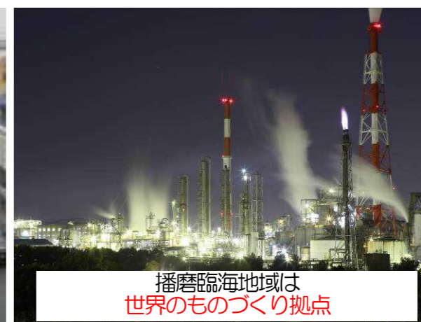
播磨臨海地域は 世界のものづくり拠点