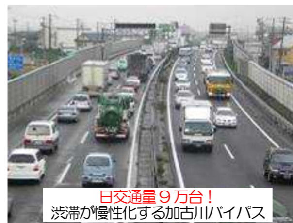
日交通量9万台! 渋滞が慢性化する加古川バイパス