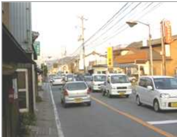
交通量の集中により渋滞している状況