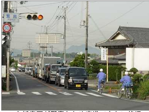
右折車両が邪魔なため直進できない状況