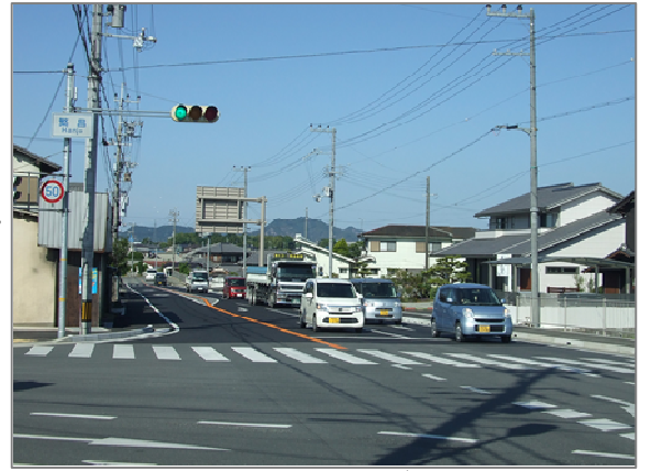
右折車線の設置によりスムーズに走行できる状況