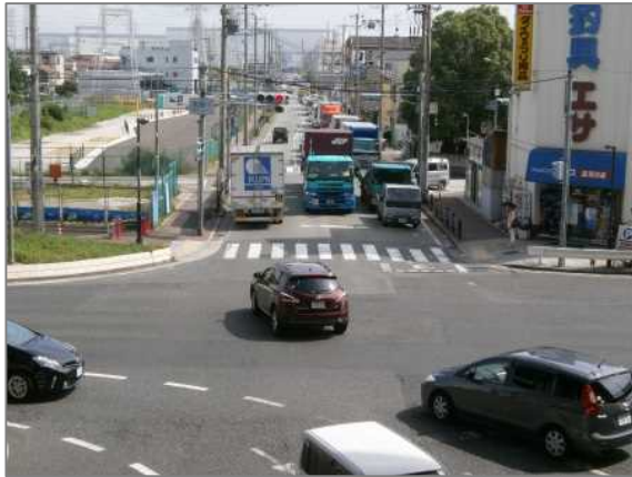
交通量が多くなかなか前に進むことができない状況