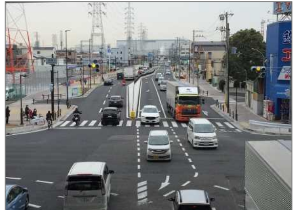
車線が増えてスムーズに走行できる状況