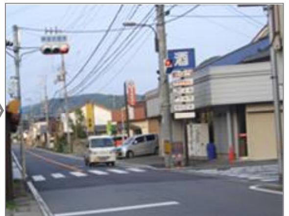
交通量の減少によりスムーズに走行できる状況