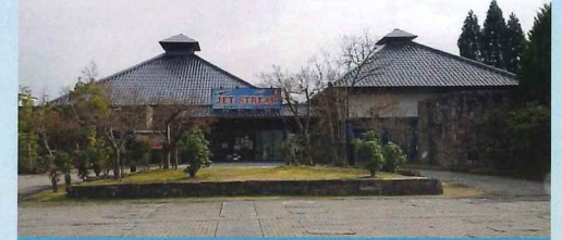
素晴らしい景色を眺めながらお食事を満喫できます