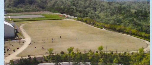
スポーツの利用も可能な芝生の公園です