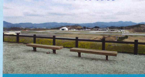
空港の全景が見渡せる眺望抜群の公園です