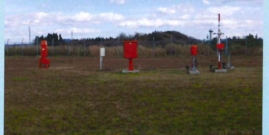
航空機の通航に必要な気象情報を観測しています