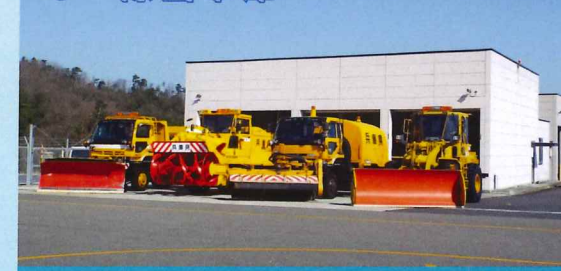
除雪車両を格納しています