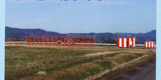
滑走路中心線へ誘導する電波を発射します