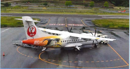
定期便と外来機が駐機します