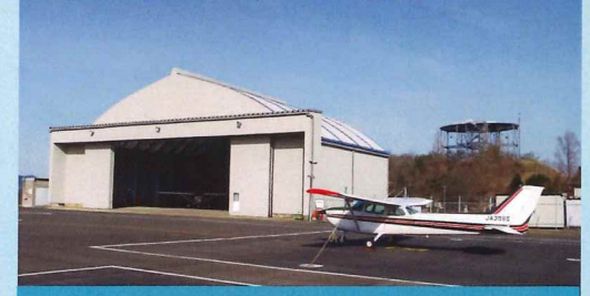
常駐機が駐機します