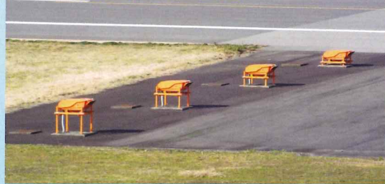
着陸する航空機に適正な進入降下角度を示します