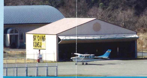
スカイ・キングの小型機等が駐機します