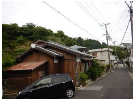
③保全対象(人家・市道)