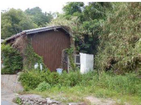
②保全対象とがけの状況