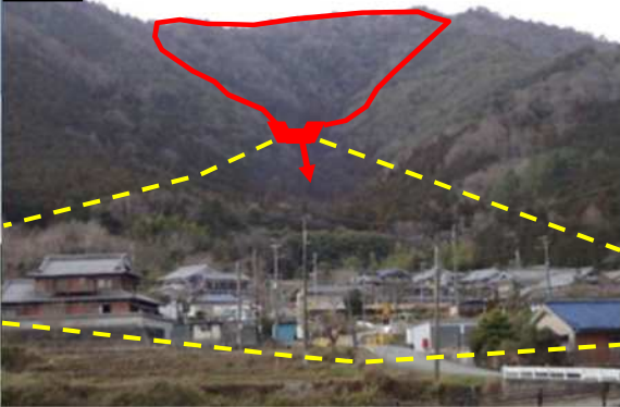
保全対象人家(谷出口より)