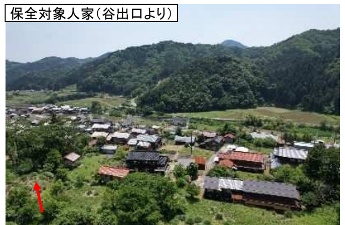
保全対象人家(谷出口より)