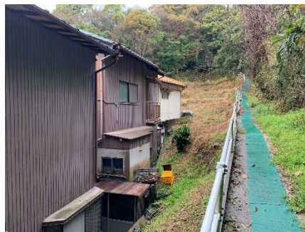
③保全対象とがけの状況