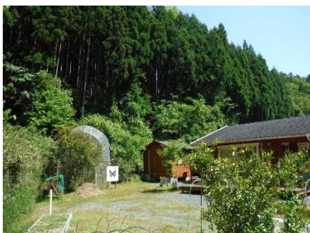
②保全対象とがけの状況