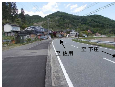
③保全対象(県道下庄佐用線)