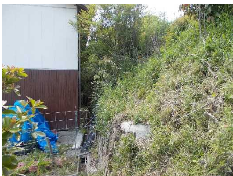
②保全対象とがけの状況