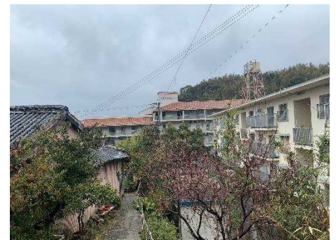
④保全対象(集合住宅)