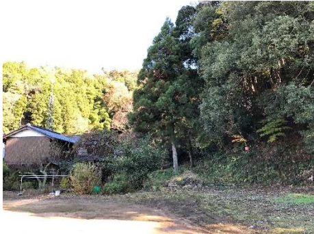
②保全対象とがけの状況