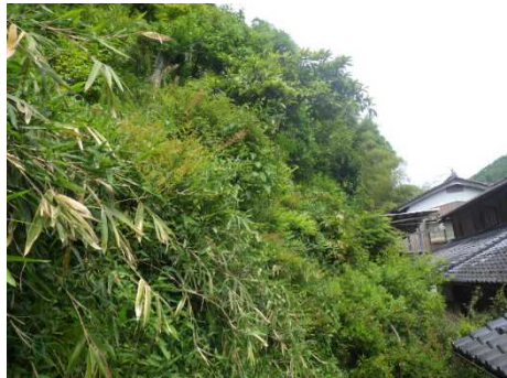
②保全対象とがけの状況