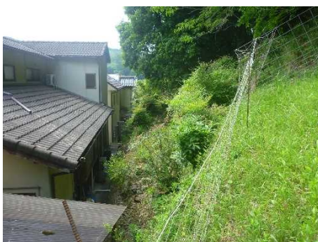
③ 保全対象とがけの状況