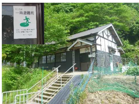
② 保全対象(山脇公民館)