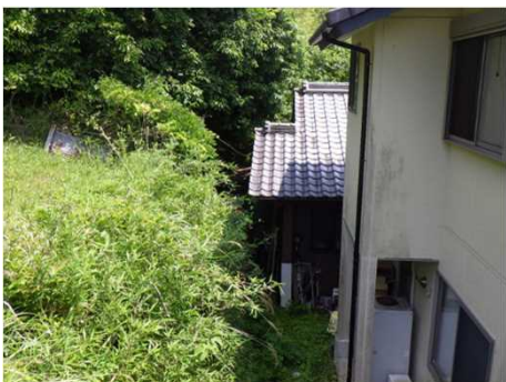
②保全対象とがけの状況