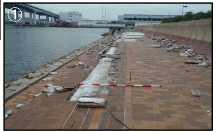
【参考】H30年台風第21号襲来時の越波状況 (南芦屋浜)