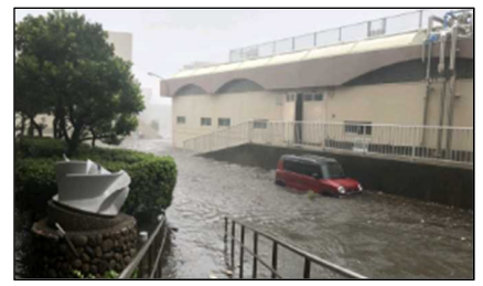
② H30年台風第21号による越波状況 (枝川浄化センター)