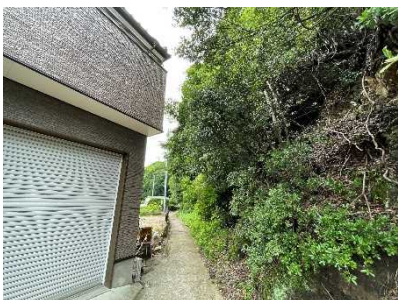
②保全対象とがけの状況