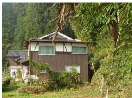
③保全対象とがけの状況