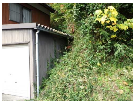
③ 保全対象とがけの状況