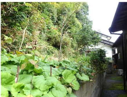
② 保全対象とがけの状況