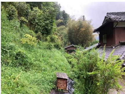
② 保全対象とがけの状況