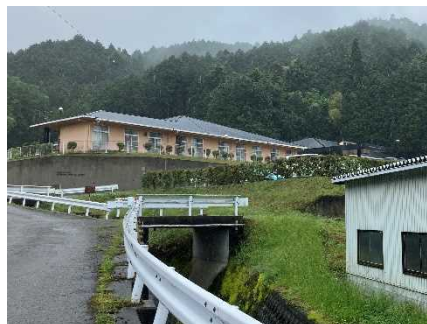
③ 保全対象(社会福祉施設)