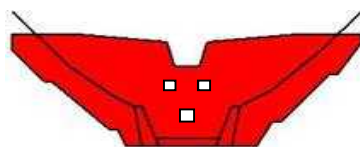
えん堤工 H=10.0m L=50.0m