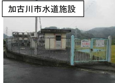
加古川市水道施設