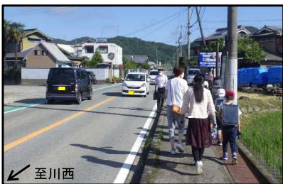
②路肩が狭く、通学生(自転車)が危険