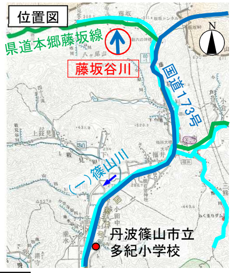
藤坂公民館(避難所)