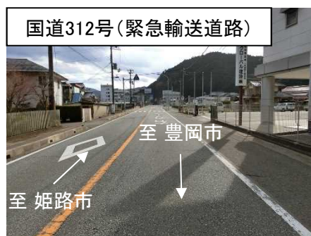
国道312号(緊急輸送道路)