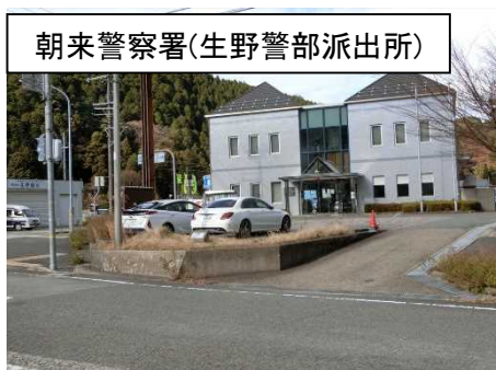
朝来警察署(生野警部派出所)