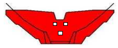
えん堤工 H=7.0m L=40.0m