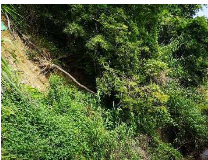
②斜面状況(西端住居裏)