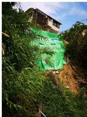
③保全対象とがけの状況