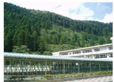
④斜面と保全対象の状況