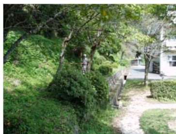
③斜面と保全対象の状況