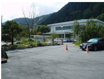
②保全対象 朝来中学校(避難所)