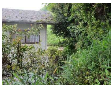
③ 斜面と保全対象の状況