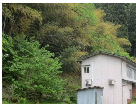
③保全対象とがけの状況