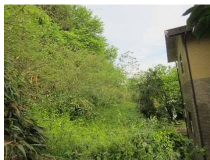
③保全対象とがけの状況