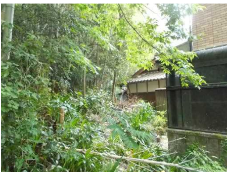
②保全対象とがけの状況