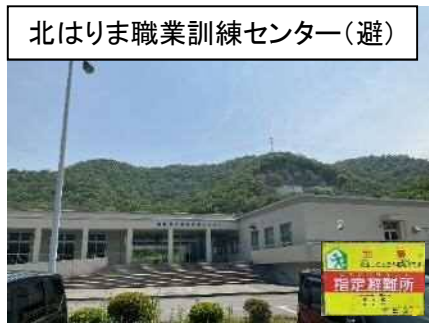
北はりま職業訓練センター(避)