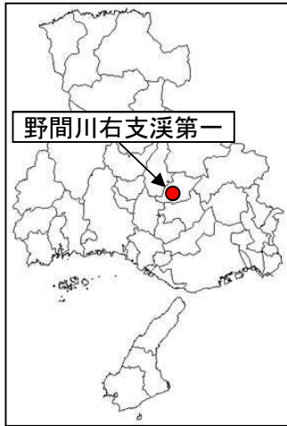
野間川右支溪第一