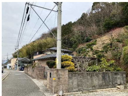
③保全対象とがけの状況