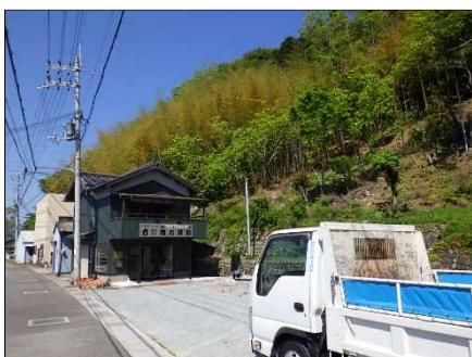
②保全対象とがけの状況