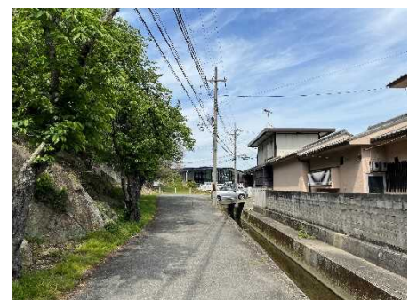
④保全対象とがけの状況