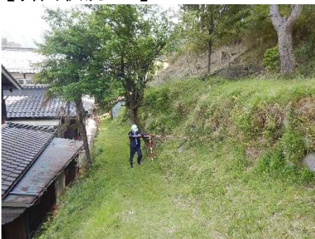
②保全対象とがけの状況