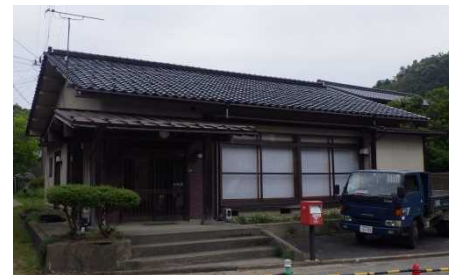
④保全対象 下塚集落センター (避難所)