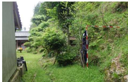
③保全対象とがけの状況