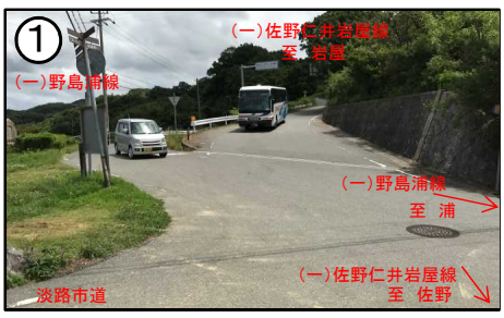
変則五差路による視認性の不良