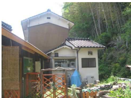
②保全対象とがけの状況