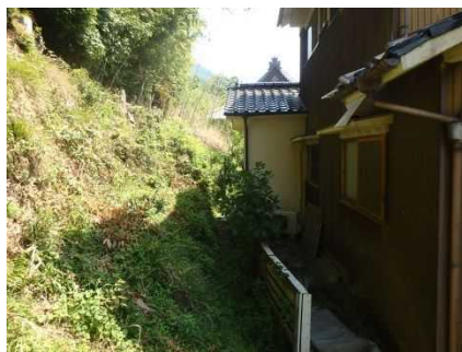
③保全対象とがけの状況